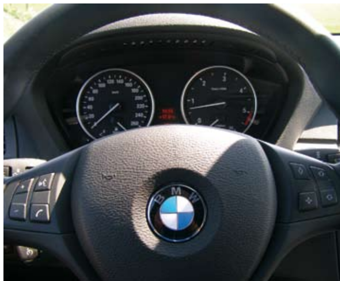
Duidelijk afleesbaar instrumentarium en bediening vanaf het stuurwiel.