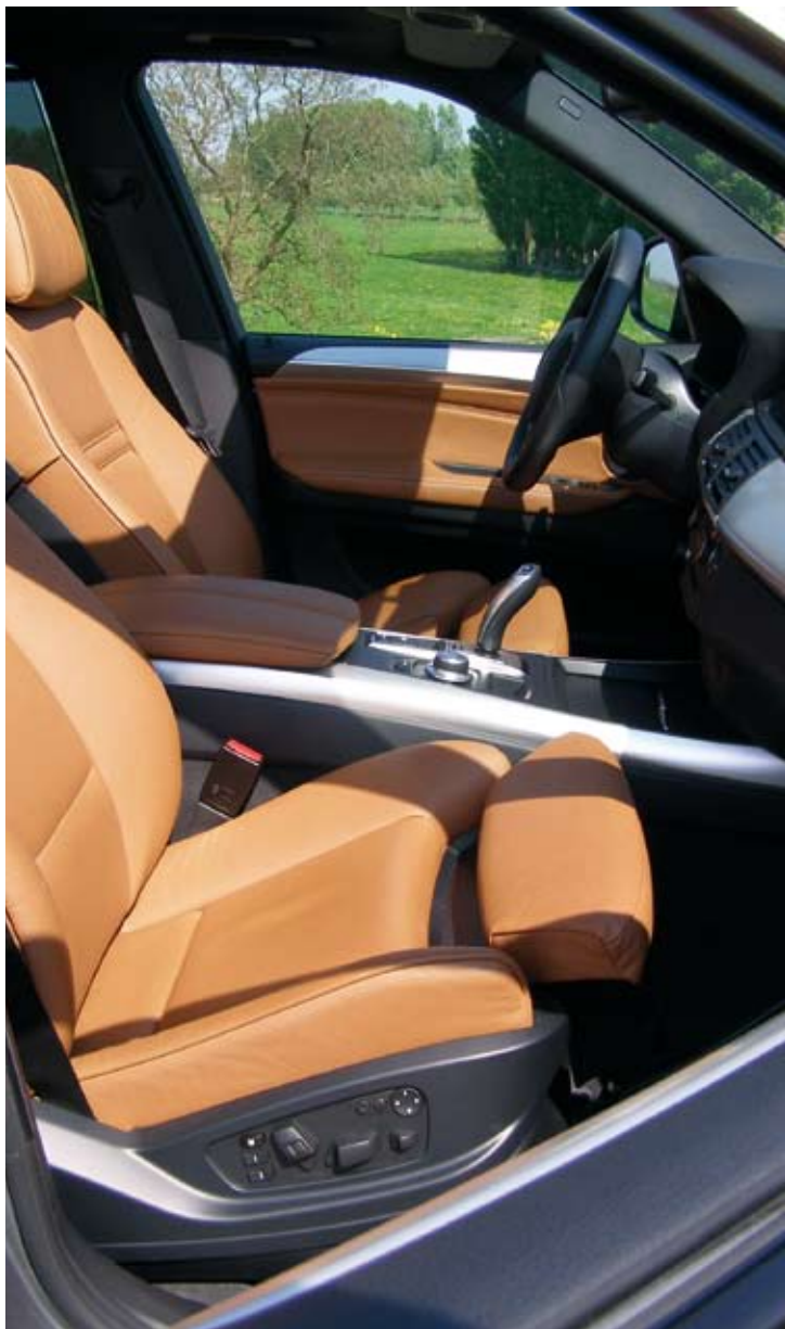
Luxe met leren bekleding en geborsteld aluminium accenten uitgevoerd interieur met reusachtige middenconsole.